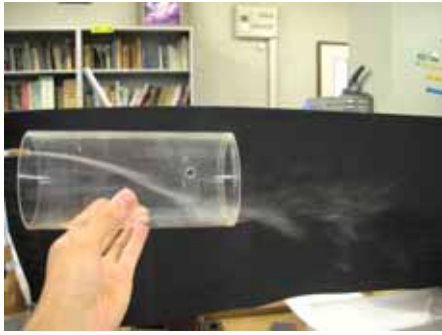
図15 水滴の様子(湿度約70%温度約30度)