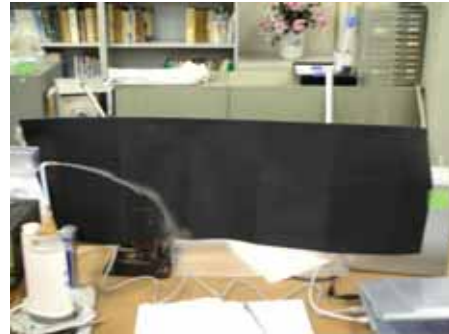
図9 水滴の様子(湿度約30% 温度約30度)