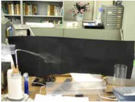
図7 水滴の様子(湿度約70%温度約30度)