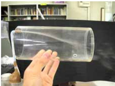
図16 水滴の様子(湿度約50% 温度約30度)