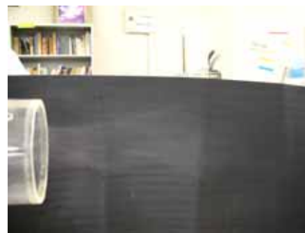
図22 水滴の様子(油脂膜 湿度約50% 温度約30度)