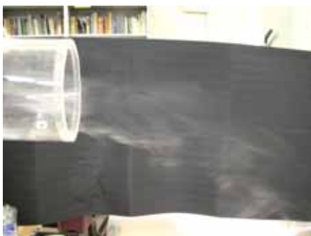
図20 水滴の様子(湿度約50% 温度約30度)