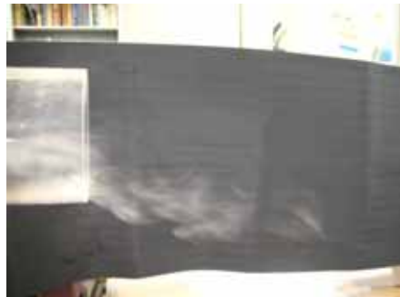
図21 水滴の様子(湿度約30% 温度約30度)