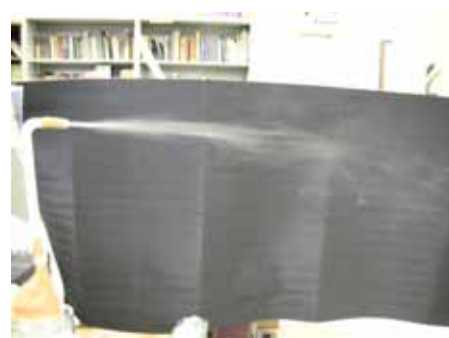
図14 水滴の様子(油脂膜 湿度約50% 温度約30度)