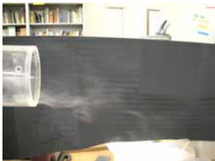
図19 水滴の様子(湿度約70%温度約30度)