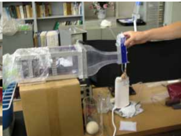
図 6 湿度測定の様子