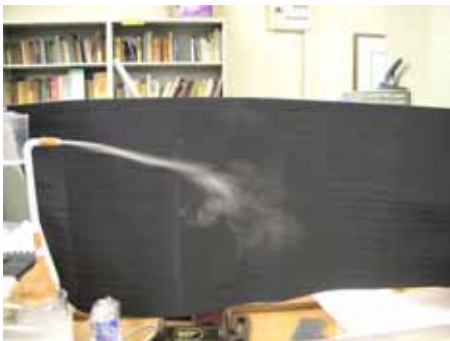
図11 水滴の様子(湿度約70%温度約30度)