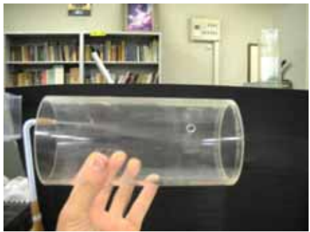
図18 水滴の様子(油脂膜 湿度約50% 温度約30度)