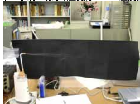
図10 水滴の様子(油脂膜 湿度約50% 温度約30度)