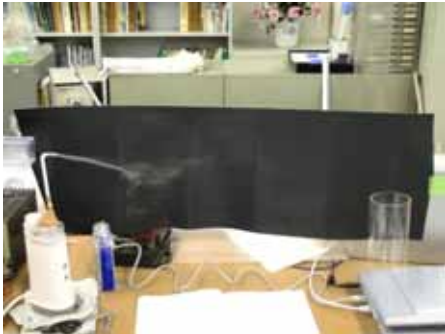
図8 水滴の様子(湿度約50% 温度約30度)