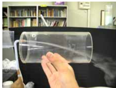
図17 水滴の様子(湿度約30% 温度約30度)