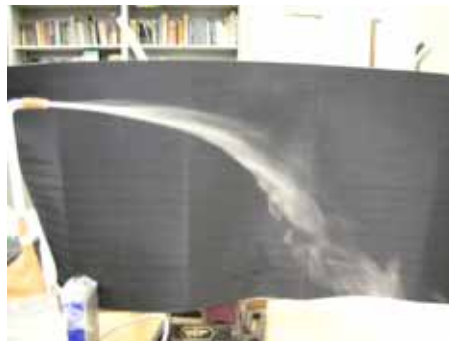
図13 水滴の様子(湿度約30% 温度約30度)