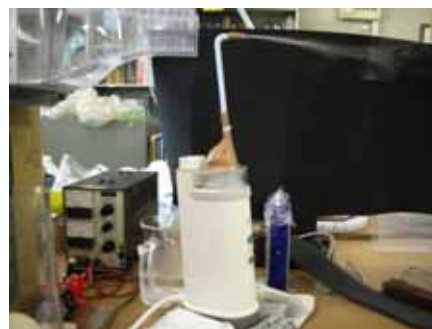
図 2 微小水滴発生装置