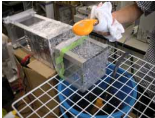
図 4 加湿の様子