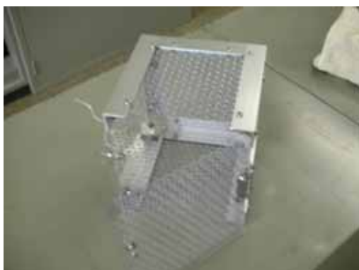
図 3 加湿箱