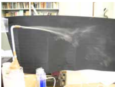
図12 水滴の様子(湿度約50% 温度約30度)